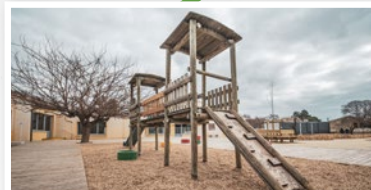
Jeux en bois