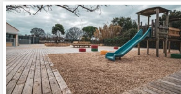
Platelage en châtaignier