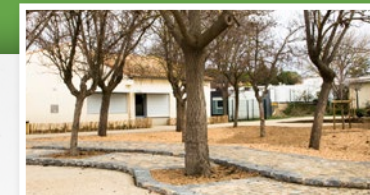
Théâtre en pierre