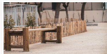
Mobilier en bois